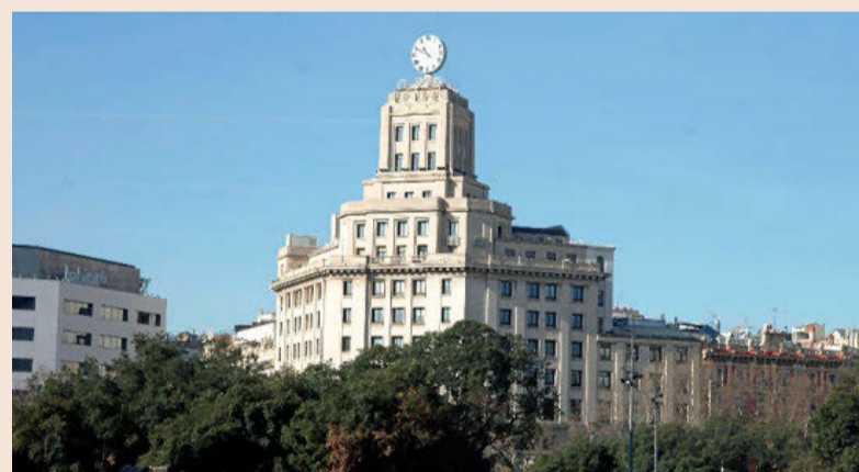
La antigua sede de BBVA en Plaça Catalunya será el lugar donde Lidl pondrá en marcha una oficina especializada en comercio electrónico para todas sus filiales europeas. En la planta baja del inmueble, propiedad de Amancio Ortega, hay una tienda de Zara.