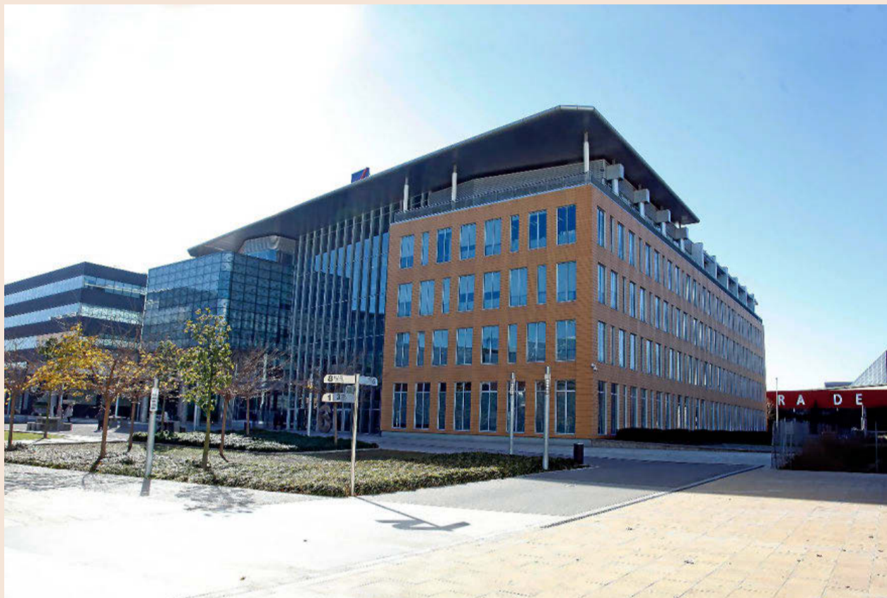
El World Trade Center Alameda Park de Cornellà de Llobregat alberga la sede de algunas empresas con unidades de negocio especializadas, como la de la aseguradora AXA. En el edificio tienen presencia compañías como Samsung, Colt o Manpower.

• Videojuegos. Las empresas de videojuegos, antaño completamente alejadas del mercado español, ven ahora Barcelona como una buena ciudad para desarrollar su actividad en el Sur de Europa. Empresas como IGG o Zeptolab estrenarán oficinas este año en la capital catalana. Otras, como King, creadora del juego Candy Crush , ya llevan años en la ciudad.