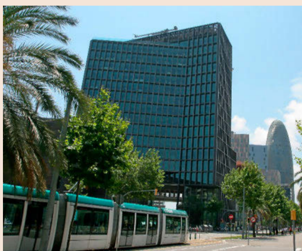
Las nuevas oficinas de la firma de videojuegos Zeptolab están situadas en el edificio de Mediapro en el 22@, donde también se graban competiciones de deportes electrónicos.

• Farmacia. También en Sant Cugat, la farmacéutica Roche Diagnostics está haciendo una fuerte apuesta por los centros de excelencia. El año pasado puso en marcha un hub digital para el área de Diabetes Care y en 2013 montó un centro de desarrollo de software para laboratorios. En total, las dos divisiones ocupan 7.200 metros cuadrados de su cuartel de operaciones y emplean a 530 personas. La compañía tiene muy claro por qué ha elegido Barcelona para acoger estos